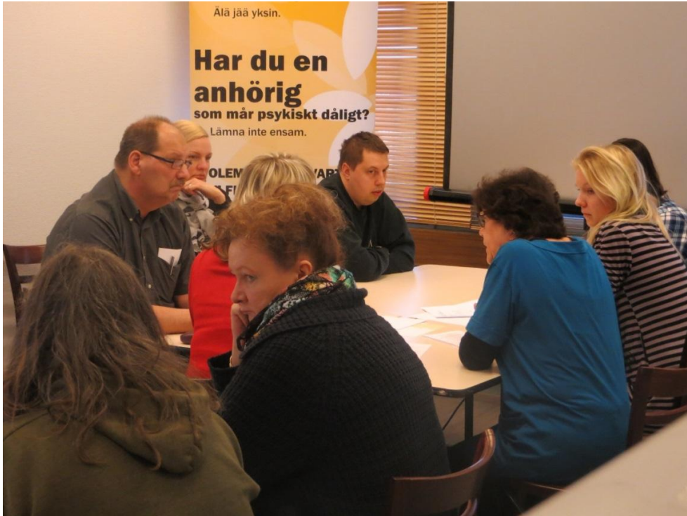
Ryhmätöskentelyä Kansankahvilassa 7.5.2014